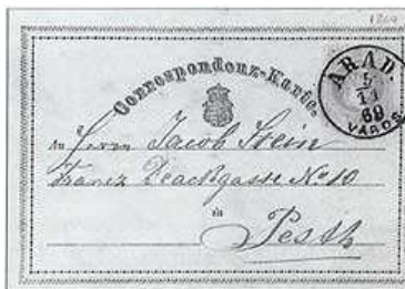
Detall anvers de la primera postal emesa al món, el primer d'octubre de 1869.