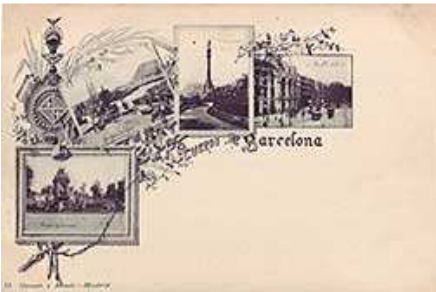
Detall de l'anvers de la primera targeta postal editada a Catalunya l'any 1893

Les primeres targetes postals que són conegudes a l'Estat espanyol, segons hi ha constància, són editades el dia 1 de novembre de 1892, per dos editors suïssos, 4 Hauser i Menet, que s'havien establert a Madrid un parell d'anys abans. No és però fins a un any més tard, el 1893, que arriba la targeta postal a Catalunya, a mà dels mateixos editors Hauser i Menet.