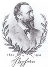
Heinrich Von Stephan 7-1-1831 - 8-4-1897

Pel que fa el naixement de la targeta postal, si en volem conèixer una mica la història, hauríem de retrocedir en el temps fins a arribar cap a l'any 1865, al Regne de Prússia (actualment Alemanya). Va ser Heinrich Von Stephan que a la Conferència Postal de Karlsruhe va proposar la creació d'una targeta postal amb unes mides de 12 x 16 cm. En una banda hi aniria un breu escrit i en l'altra el segell postal. En el concepte de la creació de la targeta postal es tenia en compte que les