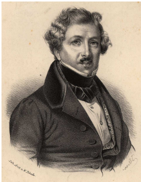
Louis Jacques Mandé Daguerre (1787-1851)

La primera fotografia que es va fer a l'Estat espanyol va ser feta gràcies al procediment de 1 Daguerre.