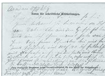
Detall del revers de la primera postal emesa al món, el primer d'octubre de 1869.

despeses d'enviament haurien de ser més econòmiques que no pas les d'una carta normal i corrent. Aquesta idea va topar amb el màxim dirigent de correus de Prússia ja que aquest va revocar