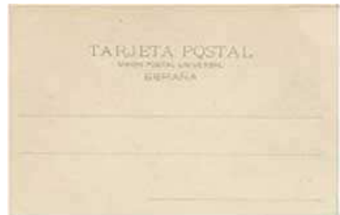
Detall del revers de la primera targeta postal editada a Catalunya l'any 1893

Aquestes primeres postals, com podem veure reproduïdes, mostren el monument a Colom i diferents records de Barcelona.. Fins al cap de 10