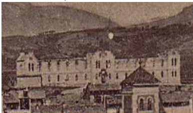
Detall de l'hospital sense la teulada.

Per catalogar una postal sense que aquesta hagi estat mai escrita, jo personalment, i com a primer pas, començo per escanejar-la. Així, amb la vista ampliada a la pantalla de l'ordinador, es poden experimentar molt més bé els detalls importants, detalls que a simple vista podrien passar per alt si no