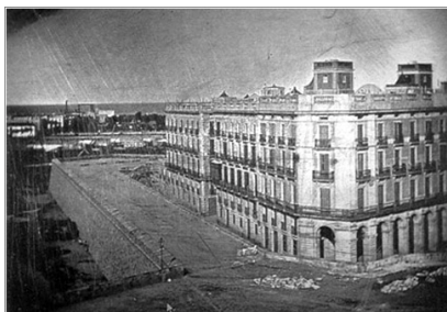
Detall de la fotografia més antiga de l'Estat espanyol datada de l'any 1848.

Com a anècdota val la pena esmentar que pocs dies abans de fer-se la fotografia, es va posar un anunci a la premsa barcelonina on es deia que alhora de fer la fotografia ningú havia de sortir al balcó. L'anunci