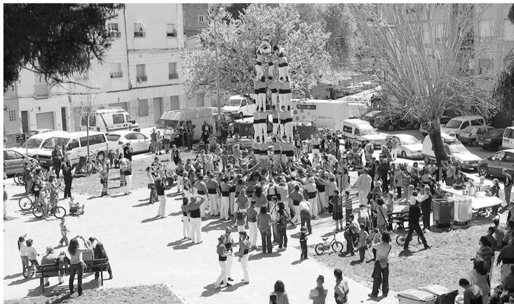
Actuación de Minyons de Terrassa en la plaza de La Maurina.